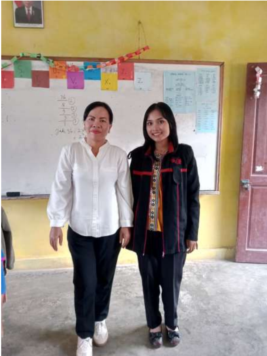
Foto Dokumentasi Dengan Ibu Wali Kelas IVA