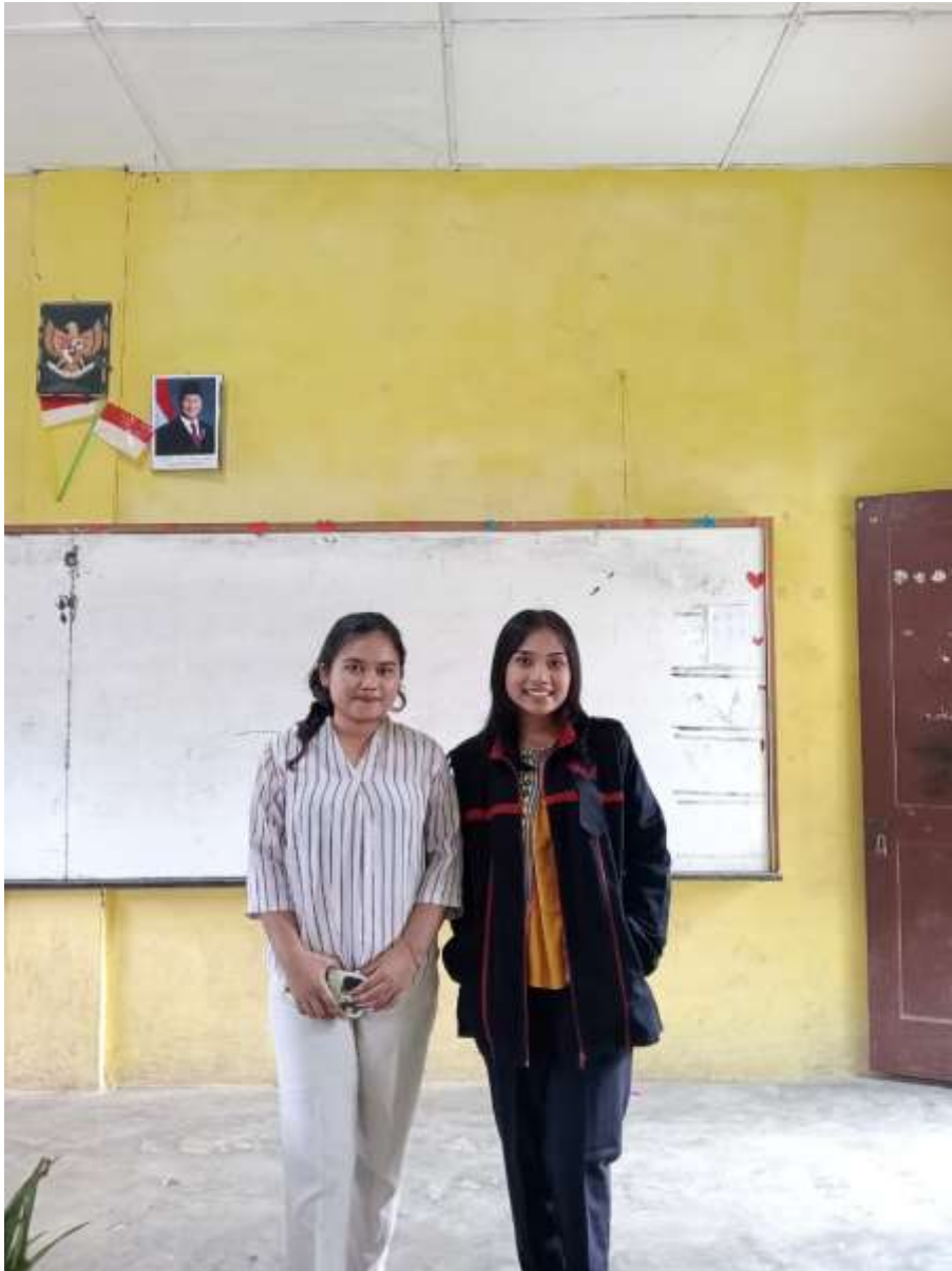
Foto Dokumentasi Dengan Ibu Wali Kelas IVB