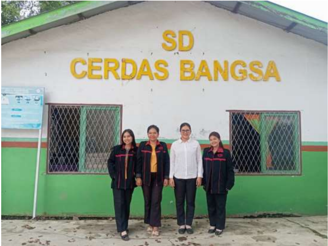
Foto Dokumentasi Dengan Ibu Kepala Sekolah SD Swasta Cerdas Bangsa Medan Namorambe, setelah selesai melaksanakan penelitian