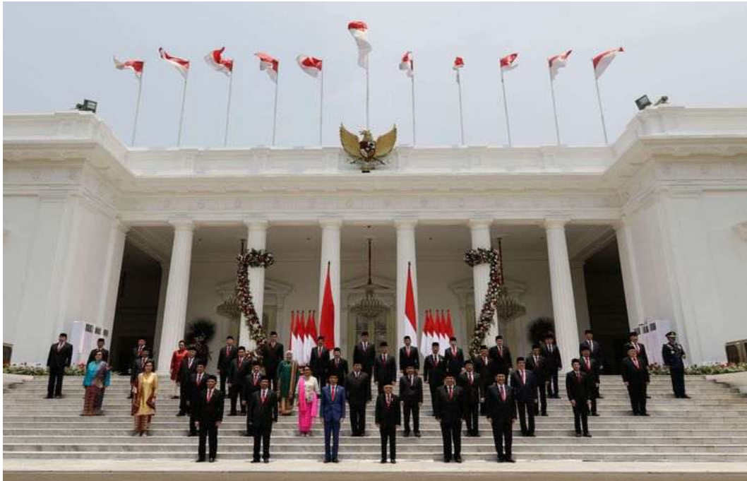
Gambar 2. 2 pembagian urusan pemerintahan pusat dan Daerah

Relasi antara pemerintahan pusat dengan pemerintahan daerah sebagai Perwujudan bentuk Negara kesatuan Republik Indonesia di tegaskan dalam pasal 18 ayat 1 UUD NRI Tahun 1945, Negara kesatuann republik Indonesia dibagi atas daerah-daerah provinsi dan daerah provinsi itu dibagi atas kabupaten dan kota ,yang tiap tiap provinsi,kabupaten,dan kota itu mempunyai pemerintahan daerah yang diatur dengan undang-undang .