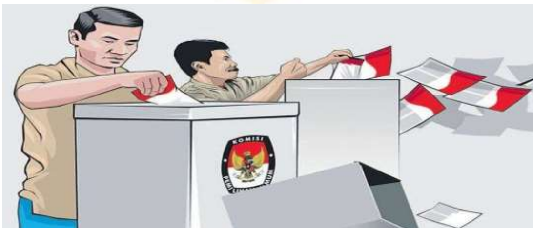
Gambar 2. 3 Pemilihan umum oleh rakyat