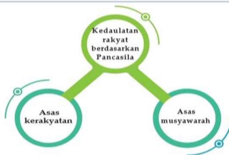
Gambar 2. 5 Kedaulatan yang berlaku di Indonesia adalah kedaulatan rakyat yang berdasarkan pancasila

Kedaulatan rakyat yang berdasarkan pada pancasila memiliki dua asas pokok, yaitu Asas kerakyatan dan asas musyawarah. Asas kerakyatan adalah asas kesadaran akan cinta kepada rakyat, manunggal dengan cita-cita rakyat, berjiwa kerakyatan, menghayati kesadaran sepejuangan, dan cita-cita Bersama. Asas musyawarah bermakna setiap kebijakan harus memperhatikan aspirasi rakyat, baik yang disampaikan melalui MPR maupun secara langsung, dan dilaksanakan dengan mengedepankan mekanisme musyawarah.