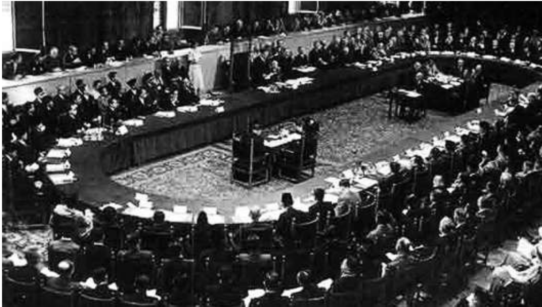
Gambar 2. 1 Konferensi Meja Bundar di Den Haag