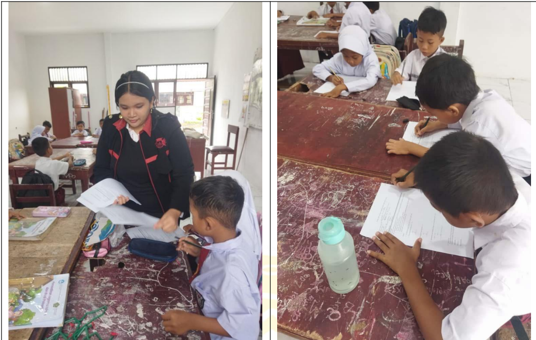
Peneliti Membagikan lembar soal Pretest dikelas II B