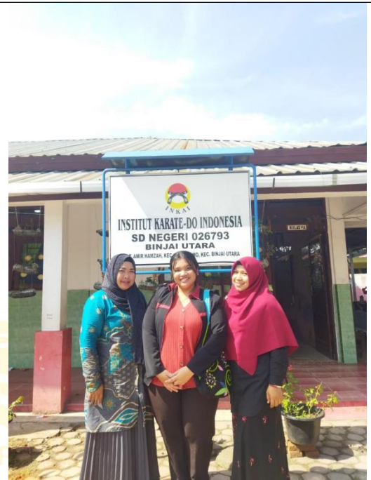
Foto dengan Wali kelas II A dan II B