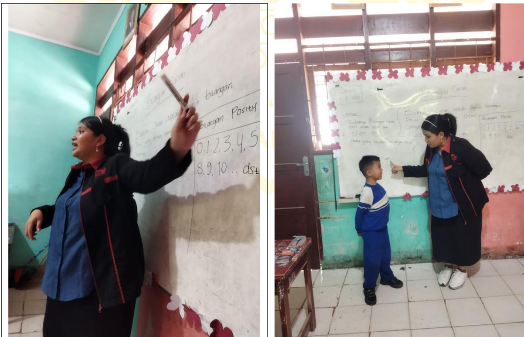
Peneliti Melakukan Perlakuan dikelas Kontrol ( II A)