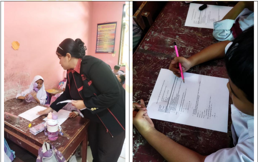
Peneliti Membagikan Lembar Soal Posttest di Kelas Kontrol ( II A )