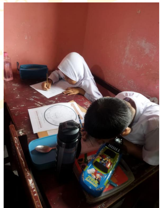
Peneliti Membagikan lembar soal Pretest dikelas II A