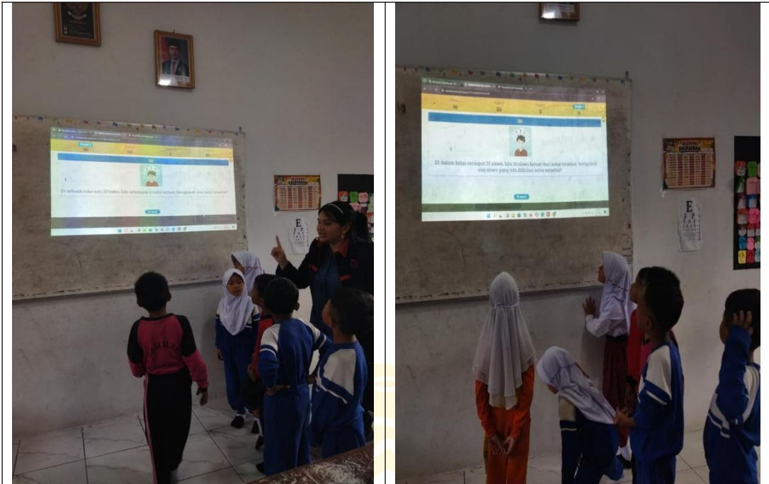
Peneliti Melakukan Perlakuan dikelas Eksperimen ( II B )