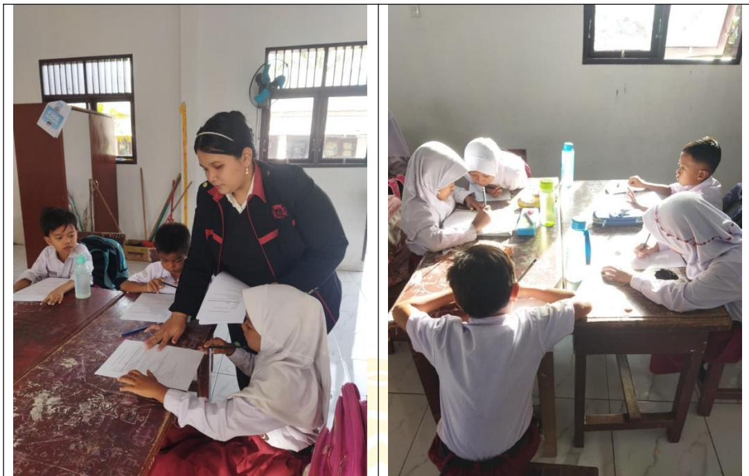
Peneliti Membagikan Lembar Soal Posttest dikelas Eksperimen ( II B)