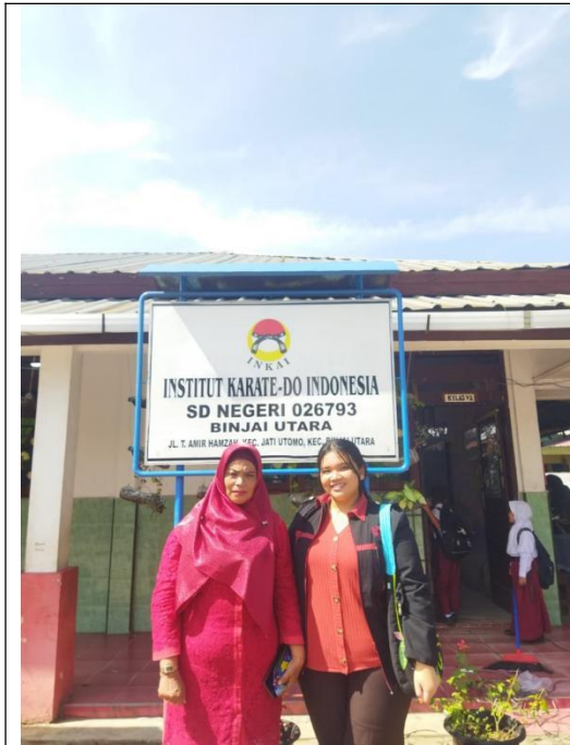
Foto dengan Kepala Sekolah