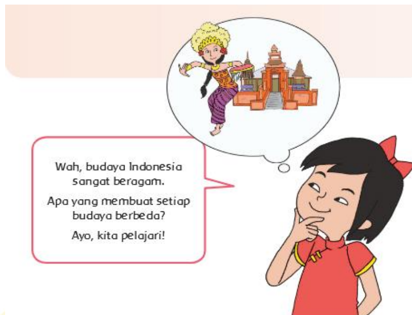
Gambar 2.4 Pembelajaran Subthema I

Indonesia adalah negara yang sangat beragam budaya, agama, dan bahasa daerahnya. Sebagai warga negara yang baik, kita wajib menghargai keberagaman tersebut.