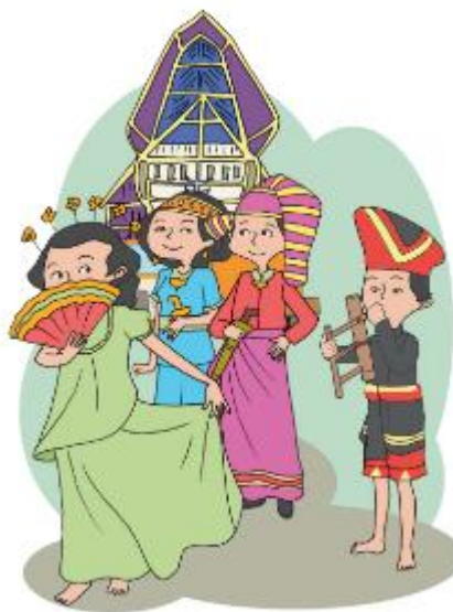
Gambar 2.3 Pameran Kebudayaan

Pawai Budaya sangat menarik bagi warga Kampung Babakan. Pawai ini selalu menampilkan keragaman budaya Indonesia. Udin dan teman-teman tidak pernah bosan menanti rombongan pawai lewat. Tahun ini mereka datang ke alun-alun untuk melihat pawai tersebut. Kakek Udin pun terlihat sabar menanti. Terdengar suara gendang yang menandakan rombongan pawai semakin dekat.