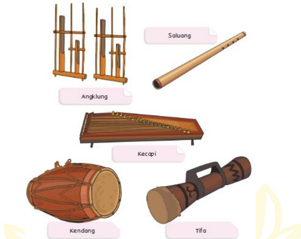
Gambar 2.5 Alat Musik Dari Berbagai Suku Di Indonesia

Tulislah nama alat musik tradisional lain yang kamu ketahui. Jelaskan asal alat musik itu, cara memainkannya, serta cara terjadinya bunyi pada alat musik tersebut!