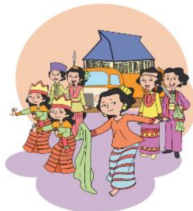
Gambar 2.2 Pawai Budaya

Pawai Budaya sangat menarik bagi warga Kampung Babakan. Pawai ini selalu menampilkan keragaman budaya Indonesia. Udin dan teman-teman tidak pernah bosan menanti rombongan pawai lewat. Tahun ini mereka datang ke alun-alun untuk melihat pawai tersebut. Kakek Udin pun terlihat sabar menanti. Terdengar suara gendang yang menandakan rombongan pawai semakin dekat.