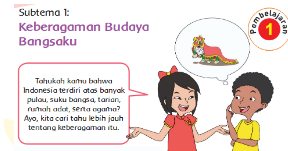
Gambar 2.1 Pembelajaran 1 Sub Thema 1