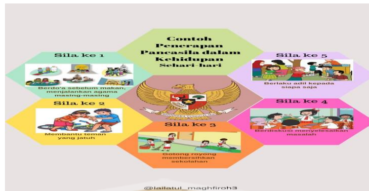
Gambar 2.1 Contoh Penerapan Pancasila

Pancasila adalah dasar negara sekaligus pandangan hidup bangsa Indonesia. Pancasila lahir dari jiwa, budaya, serta sejarah perjuangan bangsa Indonesia, sehingga nilai-nilainya mencerminkan identitas bangsa. Pancasila bukan hanya sekadar hafalan dalam pelajaran PKn, melainkan pedoman hidup yang seharusnya diwujudkan dalam perilaku nyata sehari-hari.