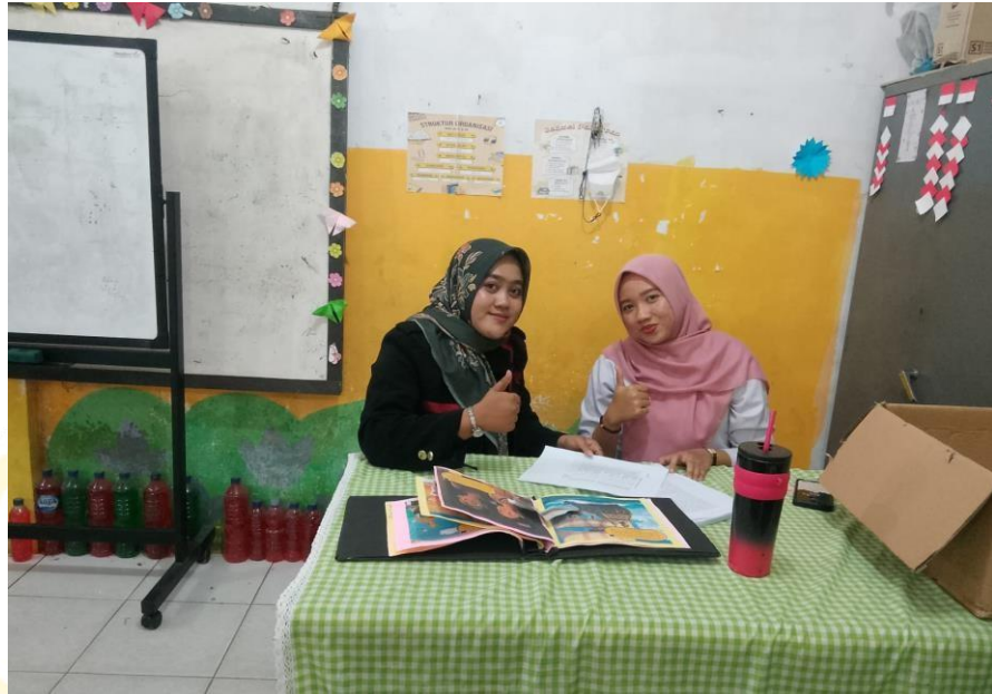
Mengetahui data awal dan mewawancarai guru wali kelas II-A