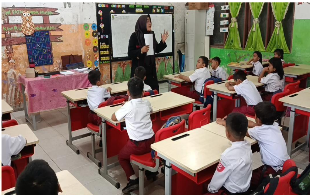
Melakukan Penelitian di Kelas II-B Tanpa Menggunakan Media Buku Dongeng