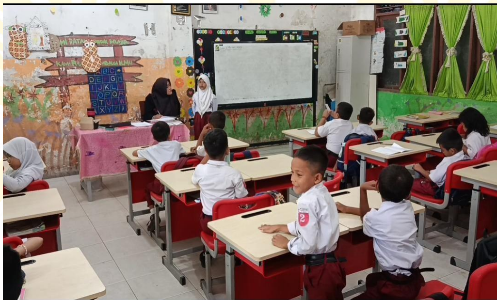
Melakukan penilaian Keterampilan Berbicara Pada Siswa Kelas II-B