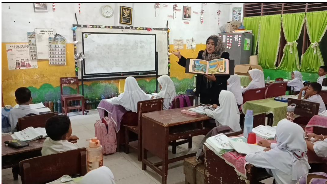
Melakukan Penelitian di Kelas II-A Menggunakan Media Buku Dongeng