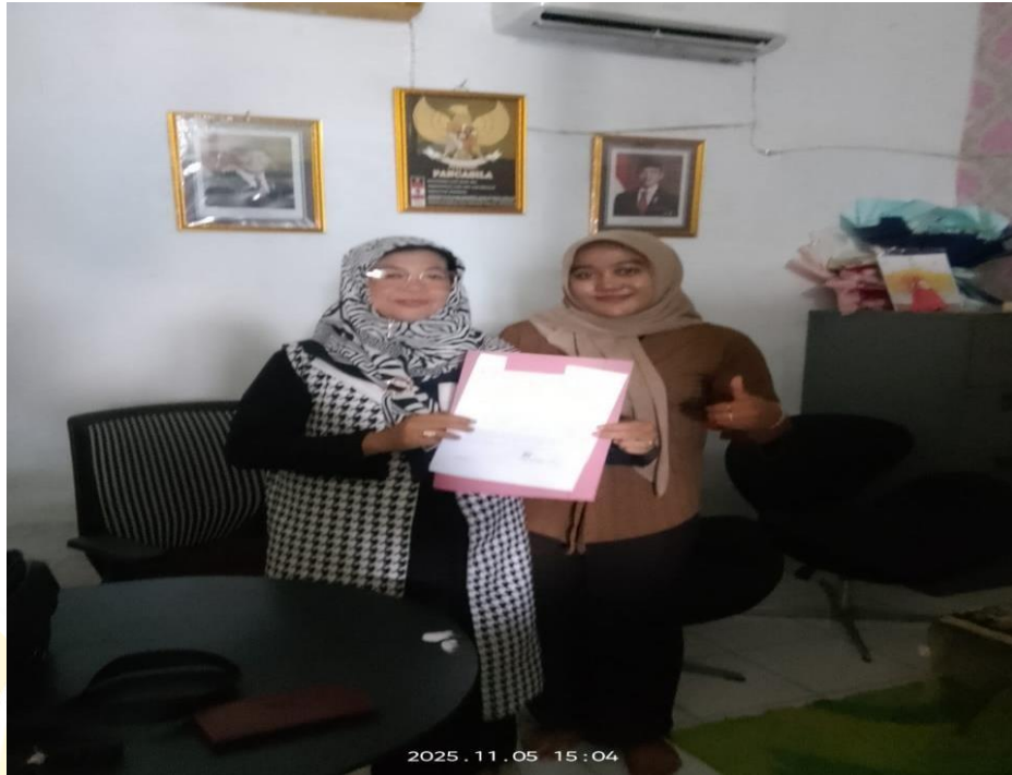
Meminta Izin Untuk Melaksanakan Penelitian di Sekolah SD Negeri 064036 Medan Kota