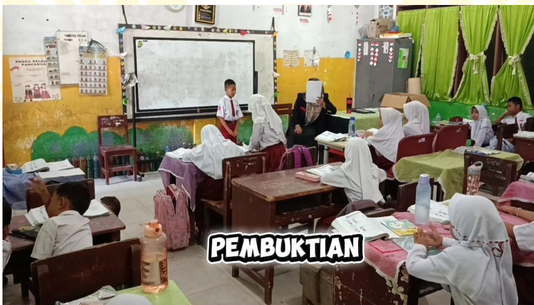
Melakukan penilaian Keterampilan Berbicara Pada Siswa Kelas II-A