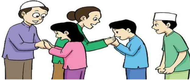
Gambar 2.2 Norma Kesusilaan