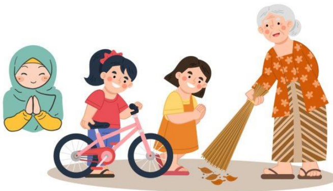
Gambar 2.3 Norma Kesopanan

Contoh norma kesopanan adalah berbicara dengan sopan dan menghormati hak-hak orang lain. Di rumah, kamu menerapkan norma kesopanan dengan menghormati orang tua dan bersikap sopan kepada saudara-saudara. Di sekolah, norma kesopanan terlihat dalam berbicara dengan sopan kepada guru dan teman-teman. Di masyarakat, norma kesopanan bisa dipraktikkan dengan mempersilakan dudul kepada ibu hamil ketika di kendaraan umum dan menghormati orang yang lebih tua.