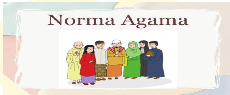
Gambar 2.1 Norma Agama

Norma agama biasanya berasal dari ajaran agama lainnya. Ibadah adalah cara kita taat dan berkomunikasi dengan Tuhan. Di rumah, norma agama bisa diterapkan dengan berdoa bersama keluarga atau melakukan kegiatan keagamaan. Di sekolah, norma agama bisa tercermin dalam pelajaran agama dan nilai-nilai moral. Di masyarakat, norma agama dapat diterapkan melalui kegiatan keagamaan di tempat ibadah. Norma agama mengajarkan untuk berperilaku sesuai tuntunan agama, taat kepada Tuhan, dan menjaga sikap dalam berinteraksi dengan orang lain.