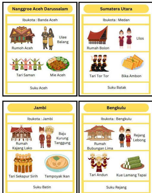
Gambar 2.1 Tampilan Bagian Depan Media Flashcard

gambar terkait dengan pokok bahasan, sehingga dapat menyampaikan pesan dari sumber kepada penerima pesan.