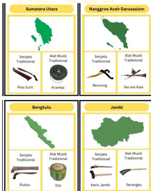
Gambar 2.2 Tampilan Bagian Belakang Media Flashcard