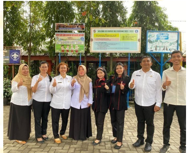
Dokumentasi saat Penelitian Rabu, 12 November 2025 Di UPT SD NEGERI 104181 Sunggal Kanan T.A 2025/2026