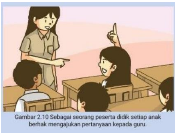
Gambar 2.10 Sebagai seorang peserta didik setiap anak berhak mengajukan pertanyaan kepada guru.