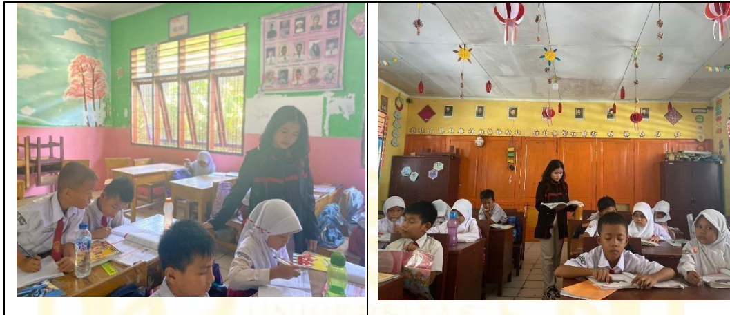
Observasi Selasa, 12 Agustus 2025 Di UPT SD NEGERI 104181 Sunggal Kanan T.A 2025/2026