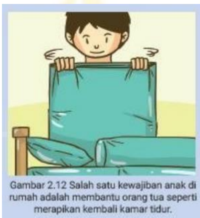
Gambar 2.12 Salah satu kewajiban anak di rumah adalah membantu orang tua seperti merapikan kembali kamar tidur.

Kalian juga harus menghormati orang tua kalian. Kalau orang tua memberi nasihat kalian harus mendengarkannya dan melaksanakan nasihat tersebut. Mengapa kalian harus berbakti dan menghormati orang tua? Ibu mengandung selama sembilan bulan. Ibu berjuang menahan sakit ketika melahirkan kalian. Ayah bekerja untuk memberi nafkah keluarganya. Ayah dan ibu membesarkan dan memberi kasih sayang kepada kalian.