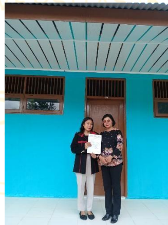
Foto bersama Kepala Sekolah SD Negeri 14 Aeksipitudai