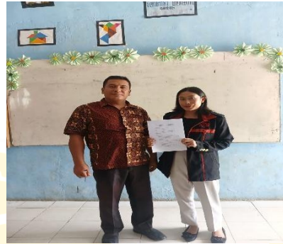
Foto bersama Wali Kelas IV dan Pengisian Angket Guru