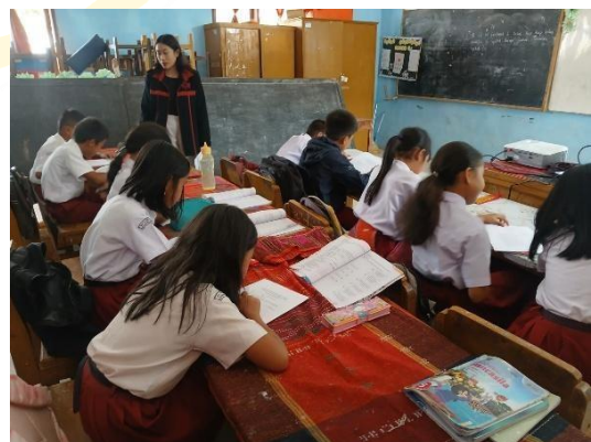
Pengisian Angket Siswa