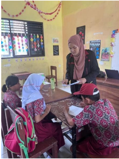
Foto Bersama Siswa kelas V-B