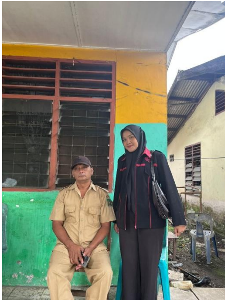
Foto Bersama Kepala Sekolah