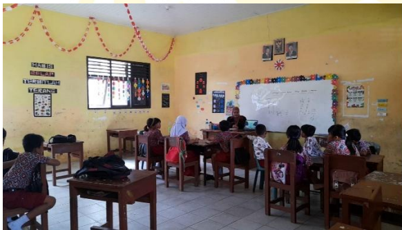
Foto bersama siswa saat sedang melakukan perlakuan