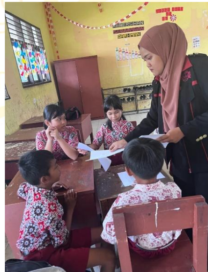
Foto Bersama Siswa kelas V-A