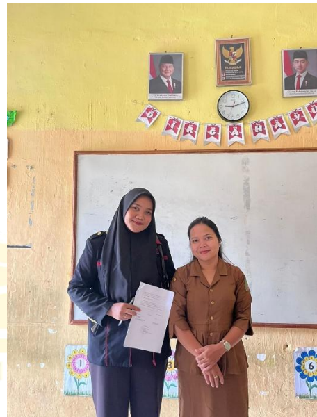
Foto bersama Wali Kelas V-A