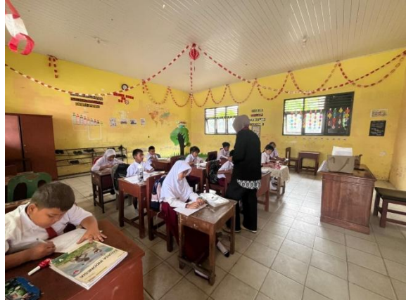
Foto Bersama siswa tanpa perlakuan