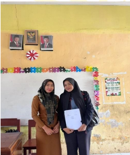
Foto Bersama Wali Kelas V-B