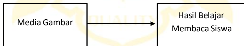
2.10 Gambar Kerangka Berpikir

Perlu diingat bahwa proses belajar mengajar, termasuk belajar membaca di kelas rendah, memerlukan tahapan yang harus dilalui secara bertahap tanpa cara instan. Media pembelajaran yang digunakan selama proses tersebut sangat membantu siswa dalam meningkatkan kemampuan membaca mereka secara lebih baik dari sebelumnya.