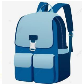
Gambar 2.9 tas.