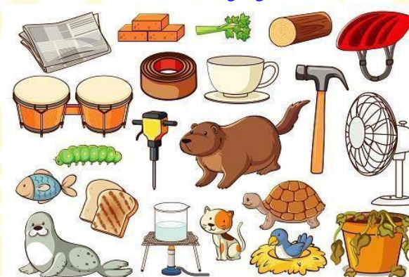
Gambar 2.3 contoh media foto

Manfaat media foto adalah sebagai berikut :