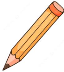
Gambar 2.8 pensil