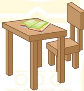
Gambar 2.7 sebuah buku,meja dan kurs