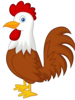
Gambar 2.5 seekor ayam

lincah. Kucing sering kali menunjukkan sikap mandiri dan suka membersihkan diri dengan menjilati bulunya.