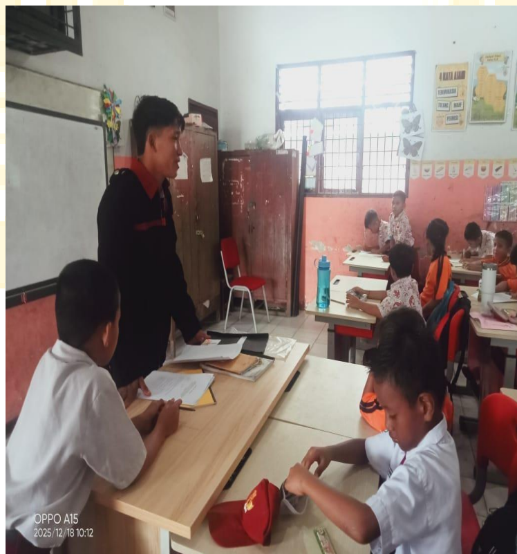
Penyampaian Materi struktur tumbuhan