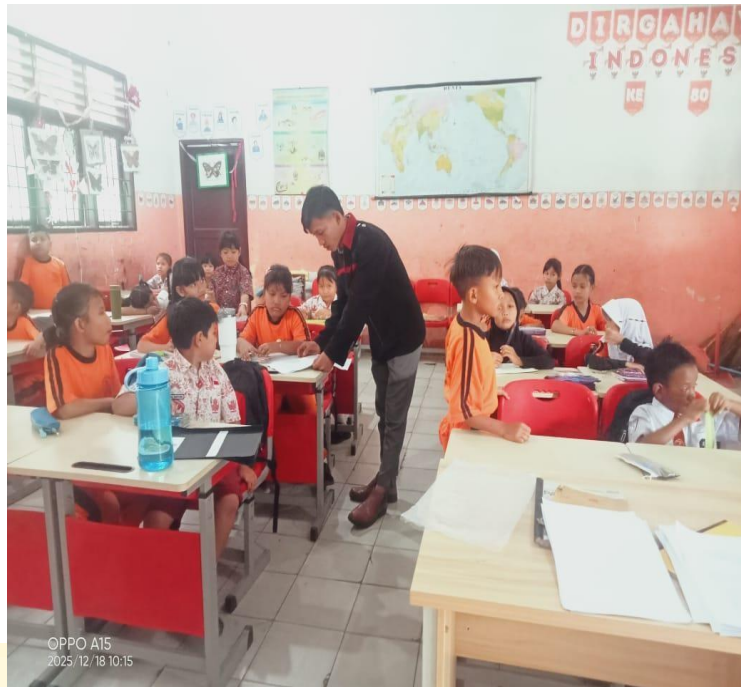
Pengisian Respon Peserta Didik