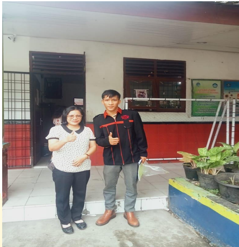
Foto Dengan Wali Kelas III