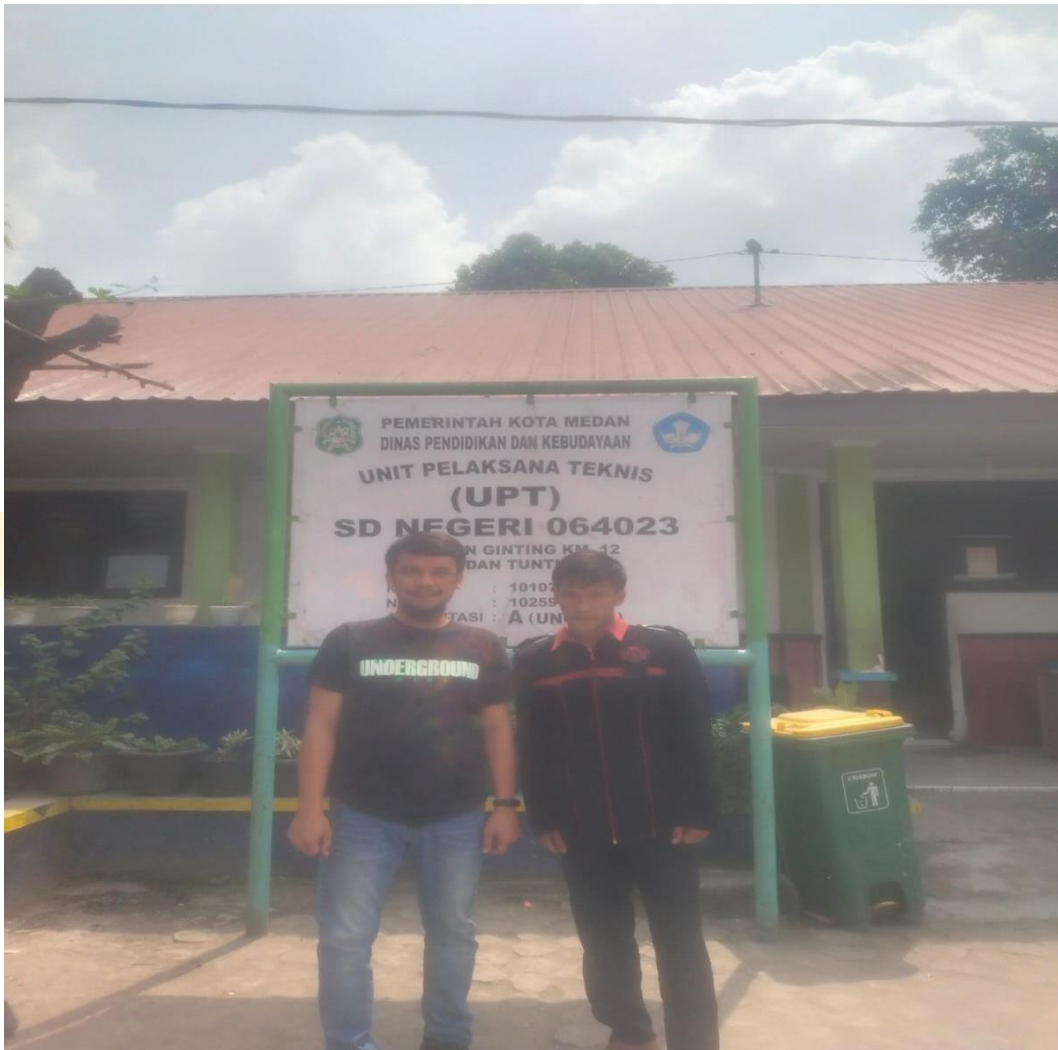
Foto Bersama Perwakilan kepala sekolah SD NEGERI 064023