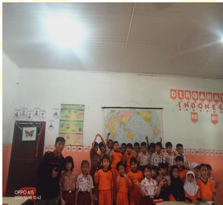
Foto Bersama Siswa Siswi kelas III