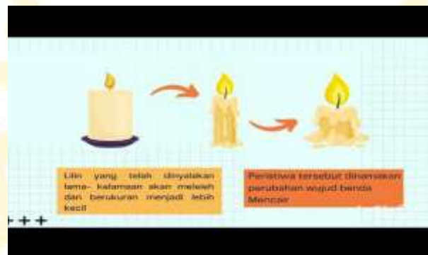
Gambar 2.2 Perubahan Wujud Benda Membeku

Contoh: air yang dimasukkan ke dalam freezer akan membeku menjadi es.