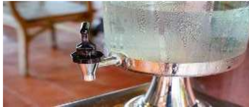
Gambar 2.4 Mengembun

Contoh: terbentuknya titik air di permukaan gelas dingin.