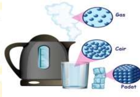
Gambar 2.3 Perubahan Wujud Benda Menguap

Contoh: air mendidih berubah menjadi uap air.