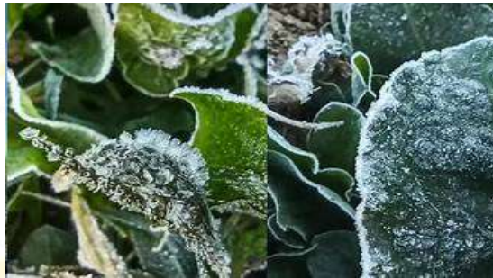
Gambar 2.6 Es Kristal Pada Dedaunan

Perubahan langsung dari gas ke padat tanpa melewati cair.