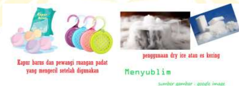
Gambar 2.5 Menyublim

Contoh: kapur barus yang lama-kelamaan habis di udara terbuka.