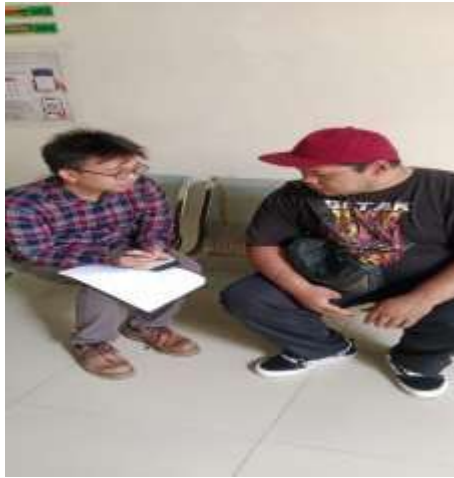
Gambar 12 Wawancara dengan Masyarakat