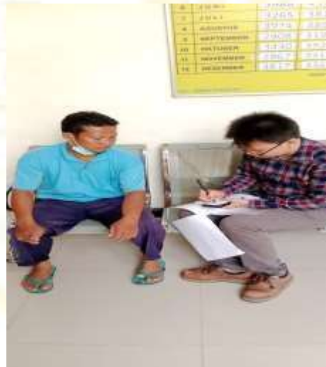
Gambar 8 Wawancara dengan Petugas Keamanan/ Kebersihan