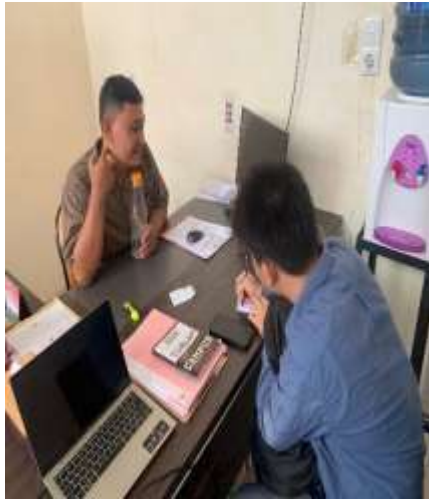
Gambar 9 Wawancara dengan PPTK (Pejabat Pelaksana Teknis Kegiatan)