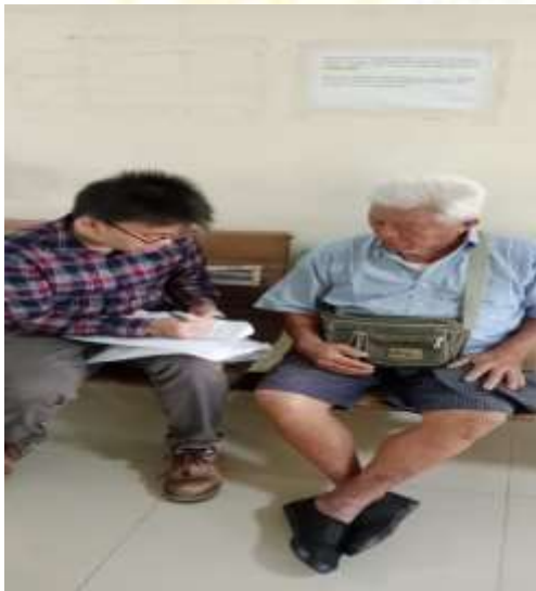
Gambar 14 Wawancara dengan Masyarakat