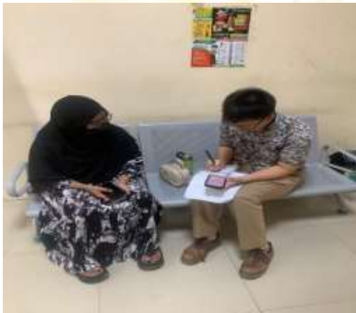
Gambar 10 Wawancara dengan Masyarakat selaku penerima layanan kesehatan