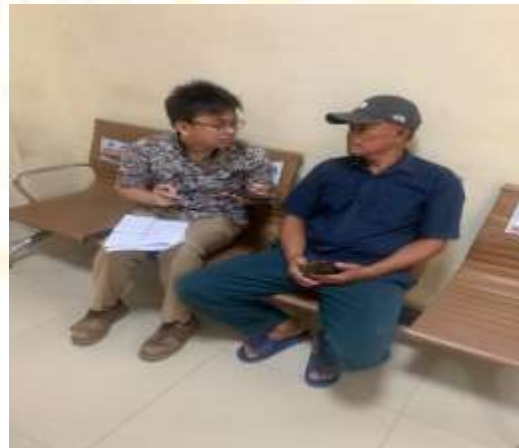
Gambar 11 Wawancara dengan Masyarakat selaku penerima layanan kesehatan