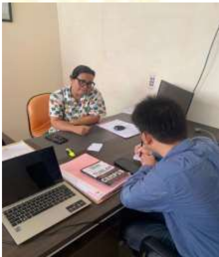
Gambar 7 Wawancara dengan Perawat Laboratorium