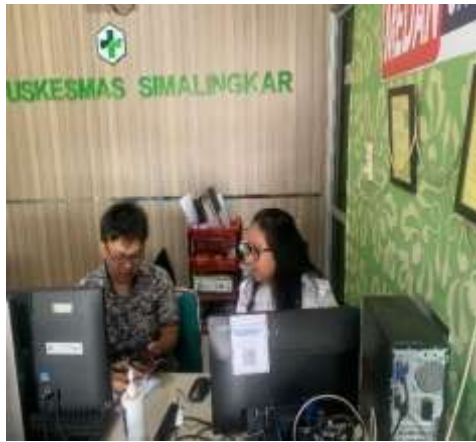
Gambar 5 Wawancara dengan bagian Pendaftaran