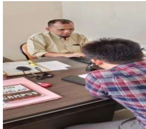
Gambar 6 Wawancara dengan Tata Usaha Administrasi