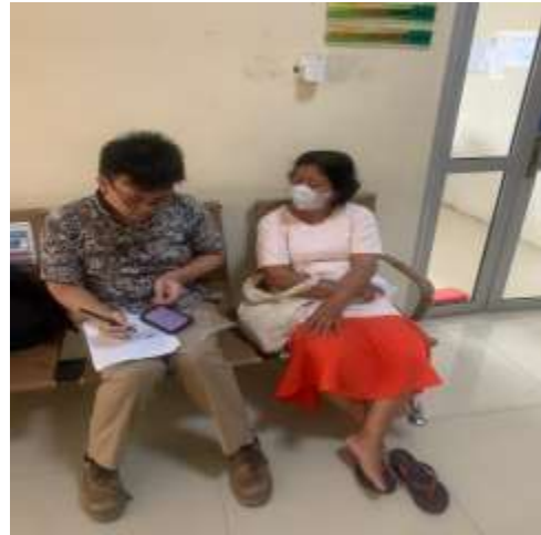
Gambar 13 Wawancara dengan Masyarakat