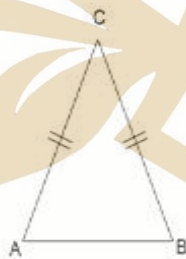
Gambar 2.1 Segitiga sama kaki, sisi \overline{AC} = sisi \overline{BC}